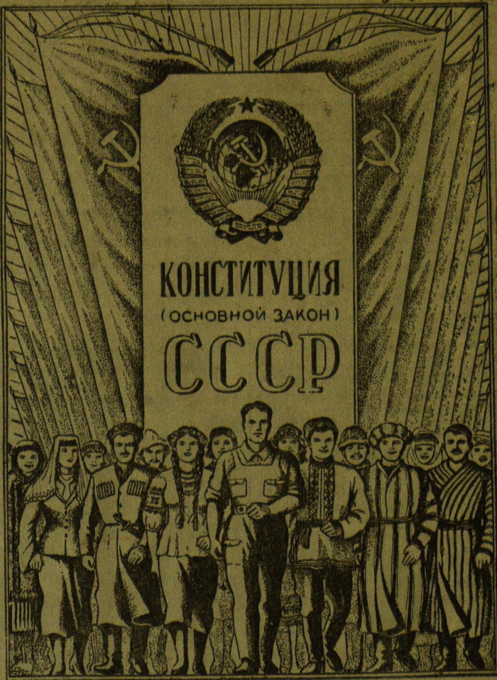
Рисунок Б. Уханова.

Свыше 50 физкультурников — членов агитколлективов спортивных обществ города «Труд», «Спартак», «Медик», «Буревестник» выступят в течение дня перед избирателями на пунктах для голосования с показательными акробатическими и гимнастическими упражнениями.